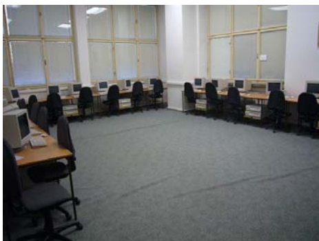
Původní učebna informatiky

Posuďte sami, jak žáci hodnotí vybavení tříd interaktivními tabulemi a učebny informatiky novými počítači.