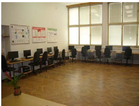
Nově vybavená učebna informatiky

„Je docela velký rozdíl mezi naší starou učebnou a novou. Už nemusíme čekat 100 let na zapínání počítače a dalších 100 let než se nám načte internetová stránka. A ne jenom funkce nových počítačů jsou super, ale taky učebna vypadá hezky.“