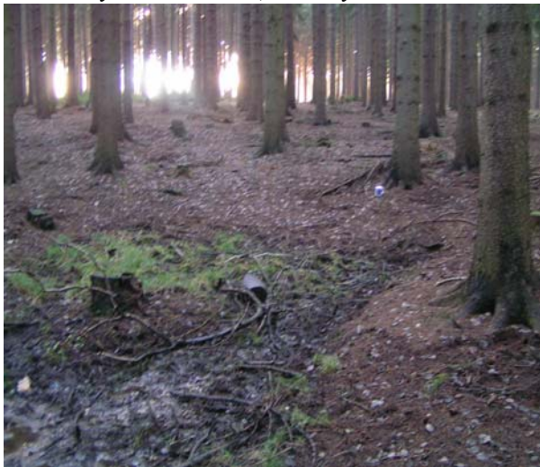
obrázek 1: pramen Bílé Vody

Podle mne by se patřilo, aby pramen Bobravy byl ten nejbližší od jejího ústí. U Bobravy tomu tak není, všechny tři větve Bílé vody, pravého to přítoku Bobravy,