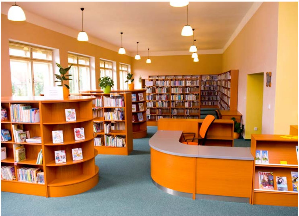
Nová Obecní knihovna na ulici Komenského 4