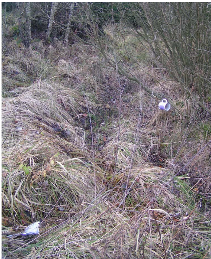
obrázek 2: pramen Bobravy

hned pod obcí Říčky, vede asfaltová silnička, která rozhodně stojí za projetí na kole. Nad obcí Rudka se potůček dělí do dvou větví nebo spíš větviček. Ta levá je delší a